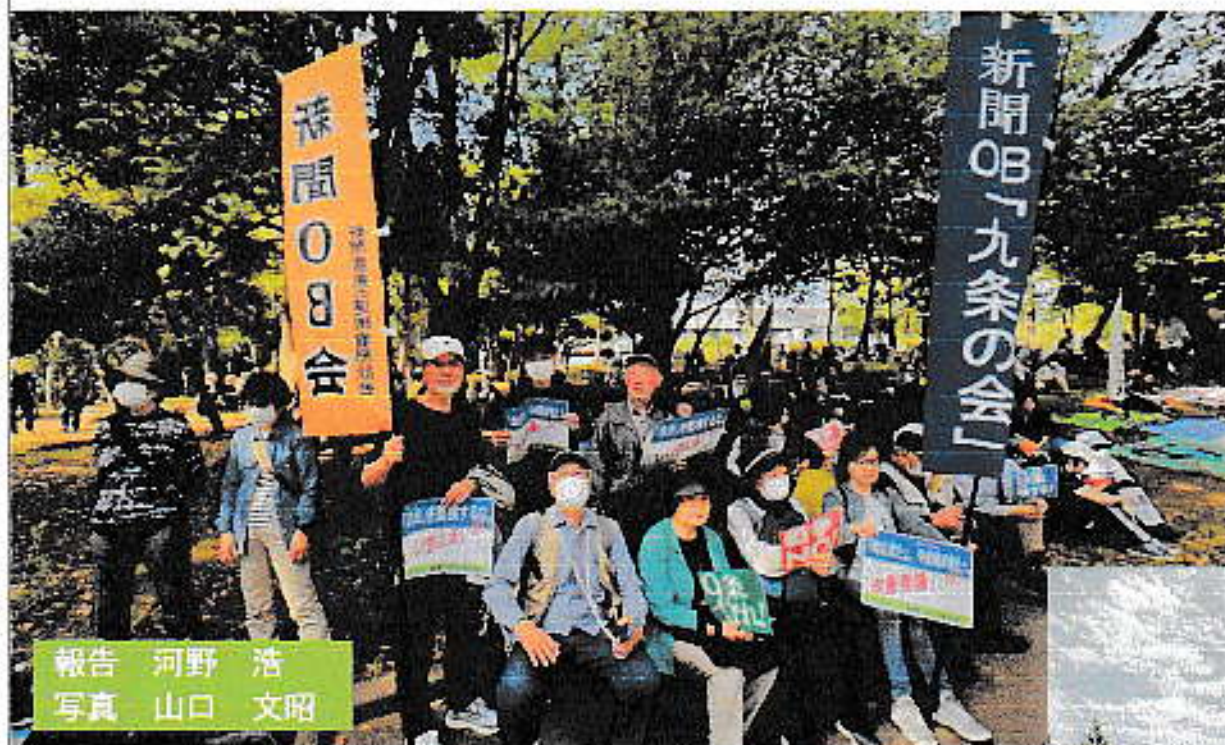
報告 河野 浩

現役自衛官が「君が代」斉唱するという政・軍一体化する中、開かれた4月12日の自民党大会で高市総裁は「時は来た」と反動的な決意を露わに憲法改憲に前のめりのもとで、憲法改憲に反対する運動・行動が全国に広がっています。