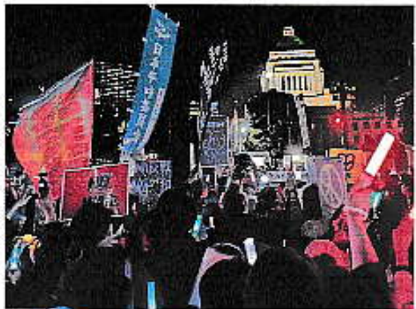
4・8国会前集會

5月3日の憲法集會にも、東京では5万人にのぼる市民が集まったほか、全国各地で市民の行動がもたれました。高市政権、戦争準備に立ち向かうのは、市民の声しかありません。