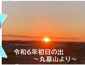
令和6年初日の出 ～丸臺山より～

【目指す学校像】 一人一人の可能性を引き出し 学びを未来につなぐ埼玉小学校 ～埼玉プライドをもって行動する子の育成～