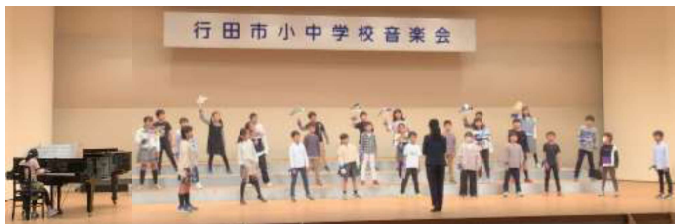
行田市小中学校音楽会

に気づき、埼玉プライド(やる気、自信、思いやり)を醸成できるよう、努力や成長を認め称賛していきます。ご家庭でもぜひ、子供たちの成長ぶりを話題にしてみてください。