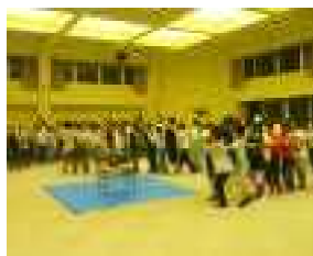
【キャンドルファイヤー】