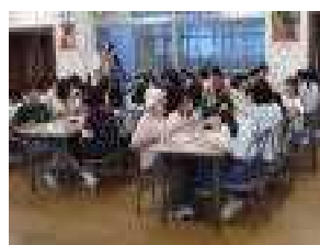
【バイキングでの食事】