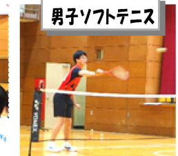
男子ソフトテニス