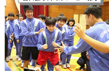
新入生を交えたゲームの様子

4月10日(水)に「新入生歓迎会」が行われました。『学校生活紹介』『部活動紹介』が行われ、本部役員主催のクイズ・ゲームでは、大いに盛り上がりました。