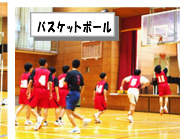
バスケットボール

4月22日(月)に部編成会議が開かれ、1年生も本入部となり、本格的に部活動が始まります。チームの一員として、がんばってください。