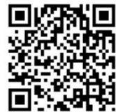
見沼小ホームページ QR

埼玉県では11月をいじめ撲滅強調月間としています。本校でも日頃らいじめ防止に努めています。今後もいじめゼロを目指して指導していきます。埼玉県からは相談窓口の案内が来ています。見沼小のホームページに一覧を載せておきますので、必要に応じてご利用ください。